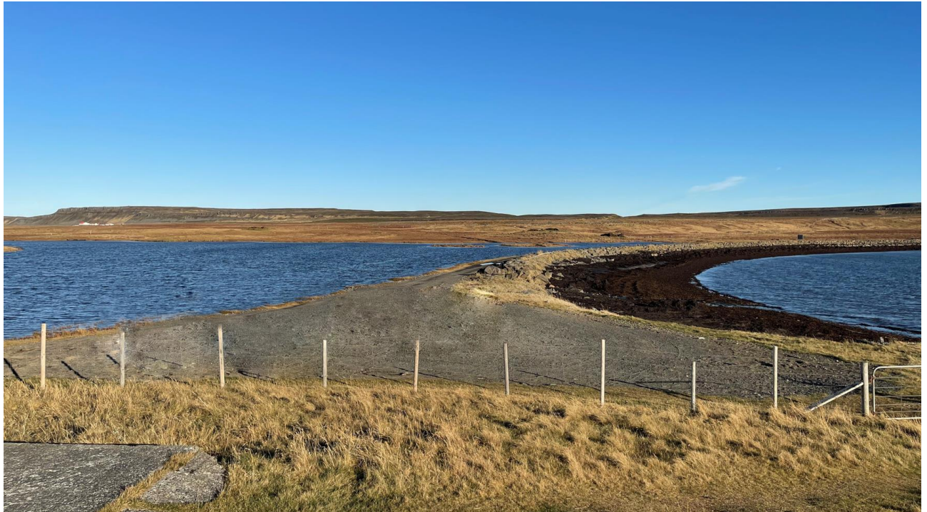
Mynd 6. Séð til austurs yfir bílastæði og aðkomusvæði.

Við minjastaði eru þegar lítil upplýsingarskilti sem þarf mögulega að endurskoða vegna staðsetningar göngustíg og stikaðra leiða, í samráði við Minjastofnun Íslands.