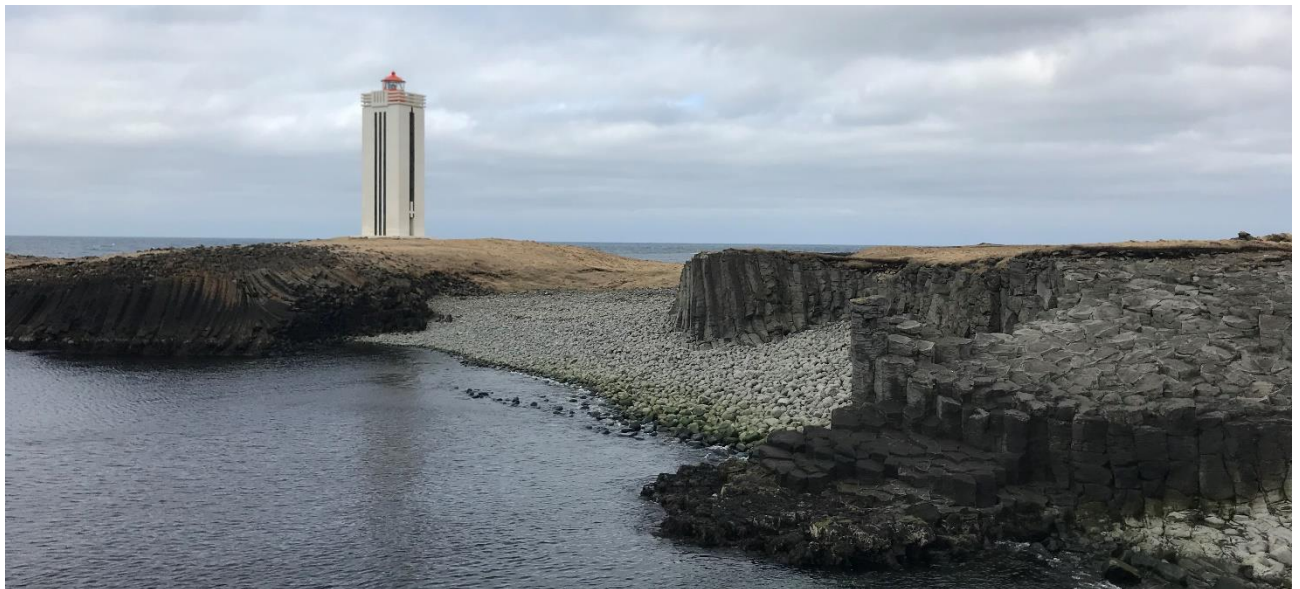
Mynd 5. Séð til norðvesturs yfir Skógarmannsvík og Kálfshamarsvita frá Sendlingaklett.

Frá þessum aðalgöngustíg er gert ráð fyrir göngustíg til suðvesturs að fallegum útsýnisstað við Sendlingaklett en frá honum er mjög fallegt útsýni yfir stuðlaberg við Skógamannsvík og að Kálfshamarsvita. Stígurinn liggur svo frá Sendlingakletti til norðvesturs á bakkanum ofan Skógarmannsvíkur og tengist inn á aðalgöngustíginn rétt austan Kálfshamarsvita en þar er gert ráð fyrir áningastað. Stígur þessi verður allt að 1,5 m að breidd og yfirborð hans verður með malarsalla eða föstu yfirborði. Gert er ráð fyrir að göngustígur þessi verði þannig hannaður að aðgengi um hann verði auðvelt fyrir alla, t.d. með viðráðanlegum halla.