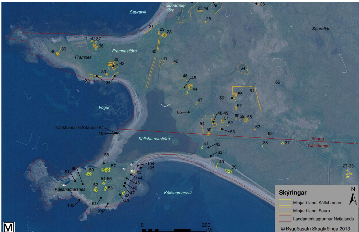
Mynd 2. Hluti minja innan skipulagssvæðisins í landi Kálfsáms og Saura.

Í kafla 2.5, varðveisla minja, er fjallað um hvort og hvaða áhrif fyrirhugaðar framkvæmdir skv. deiliskipulagi hafa á minjastaði.