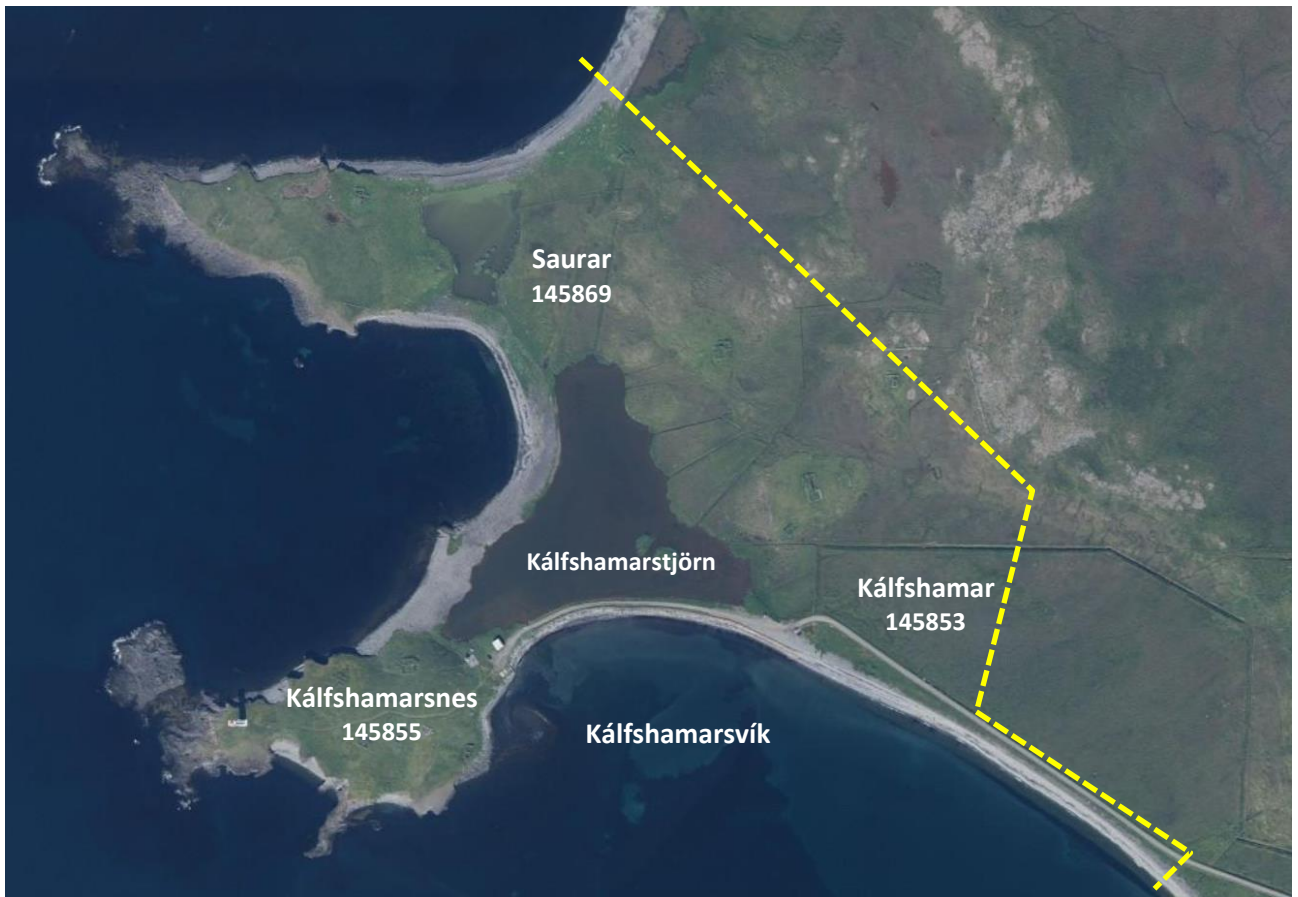
Mynd 1. Afmörkun skipulagssvæðisins

Skipulagssvæðið er um 23 ha að flatarmáli.