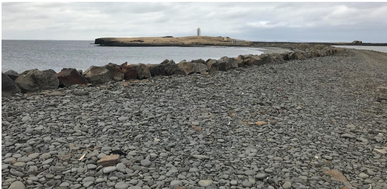
Mynd 4. Séð til vesturs yfir Kálfshamarsvík og Kálfshamarsvíta.

á núverandi veg sunna Kálfshamarstjarnar. Þaðan nýtist núverandi vegur sem þjónustuvegur og aðalgönguleið að Kálfshamarsvíta.